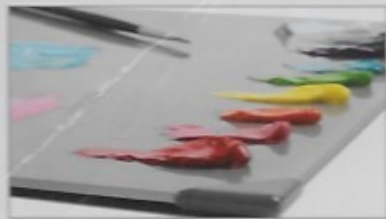
Artist Palette | Palette d'artiste | Paleta de artista