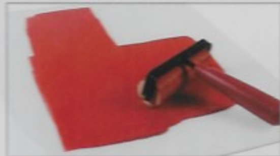
Print ink and mono printing Impression à l'encre et monoimpression Impresión de tinta e impresión monocromática